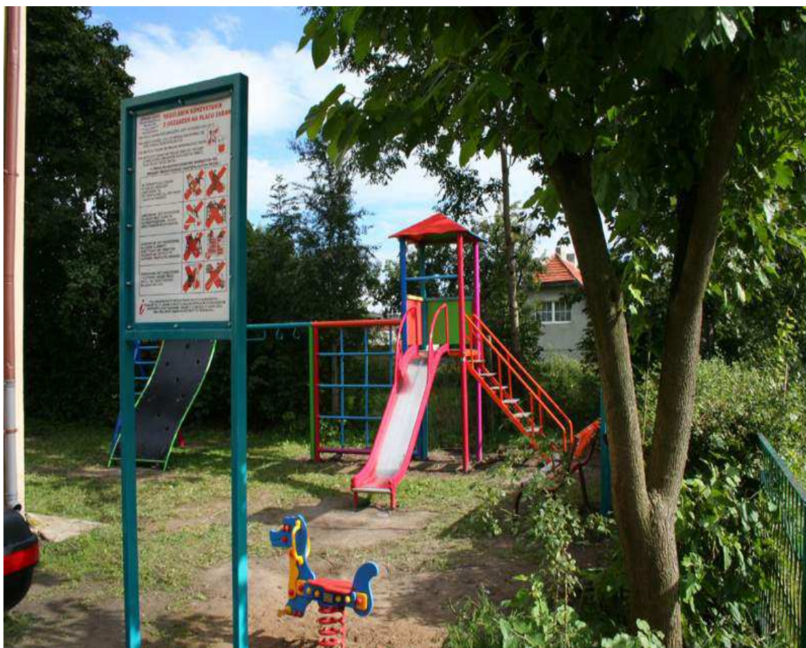
Plac zabaw dla dzieci w Orzechowie

Życie mieszkańców Orzechowa cechuje wzrastająca aktywność, efektywne działanie, rozważa i przedsiębiorczość. Do aktywnie działających kół i organizacji zaliczyć należy Koło Gospodyń Wiejskich i Ochotniczą Straż Pożarną. Problemy mieszkańców wysuwane są i omawiane głównie na zebraniach wiejskich bądź też zgłaszane indywidualnie do sołtysa i przekazywane do uwzględnienia ich w planach realizacji.