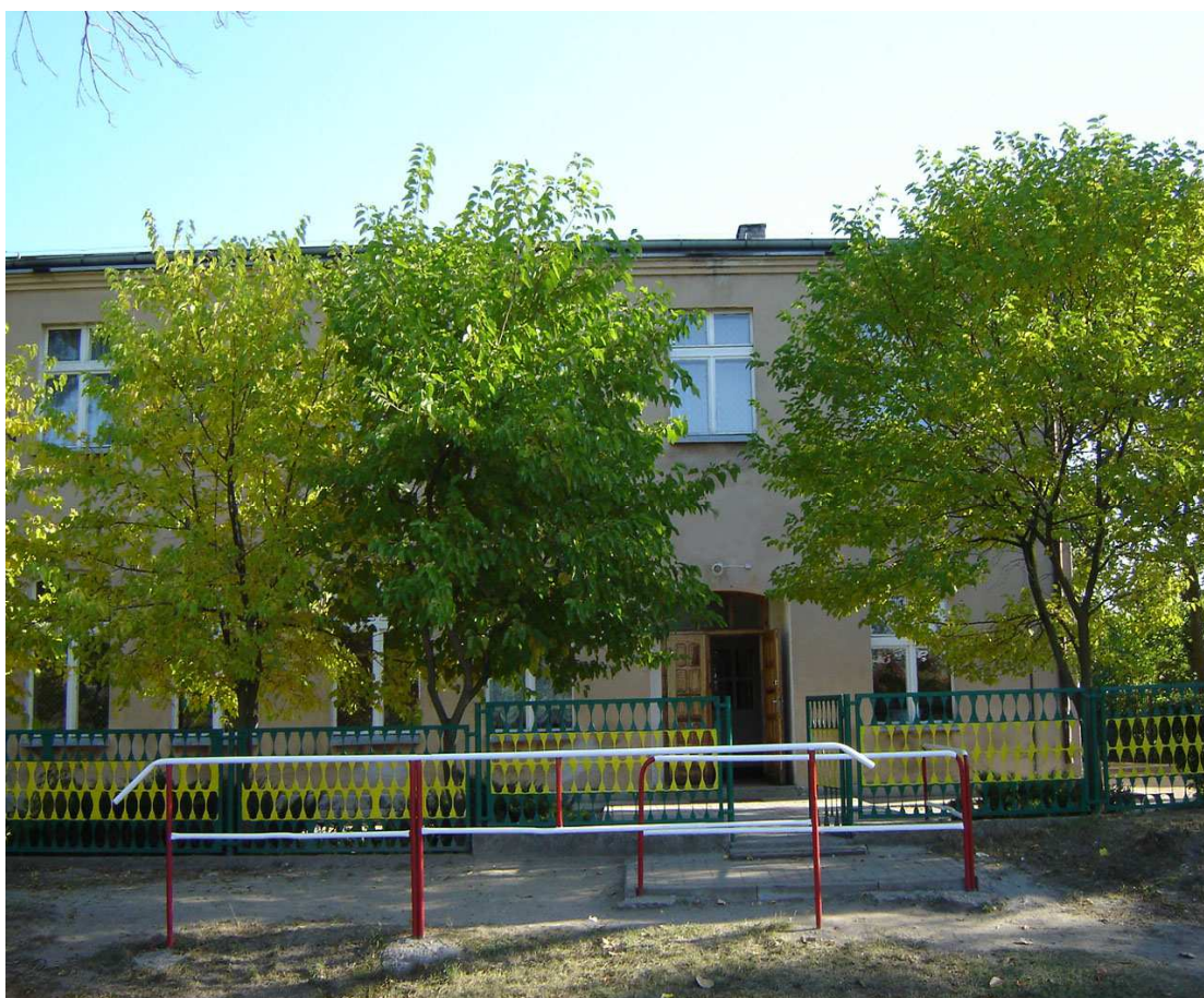
Budynek świetlicy wiejskiej w Orzechowie

Do grupy obiektów architektury i budownictwa o wartościach kulturowych należą również budynki szkół podstawowych, wzniesione w II poł. XIX w. i na pocz. XX w., w tym budynek szkolny w Orzechowie, budynek plebanii w Orzechowie oraz budynki mieszkalne i zabudowania gospodarcze wzniesione w XIX w. i I poł. XX w. Obecnie w budynku po byłej szkole podstawowej w Orzechowie funkcjonuje świetlica wiejska.