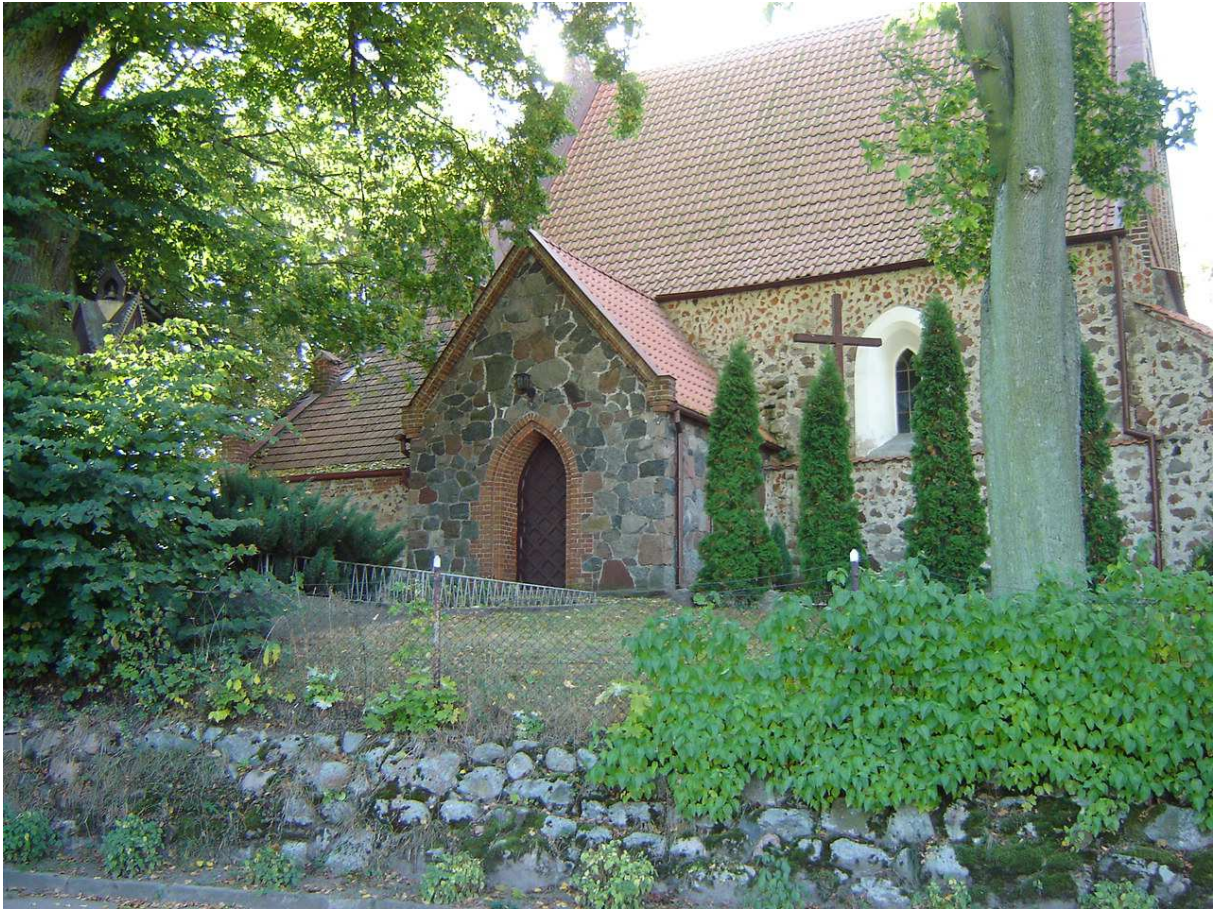
Kościół p.w. św. Marii Magdaleny w Orzechowie