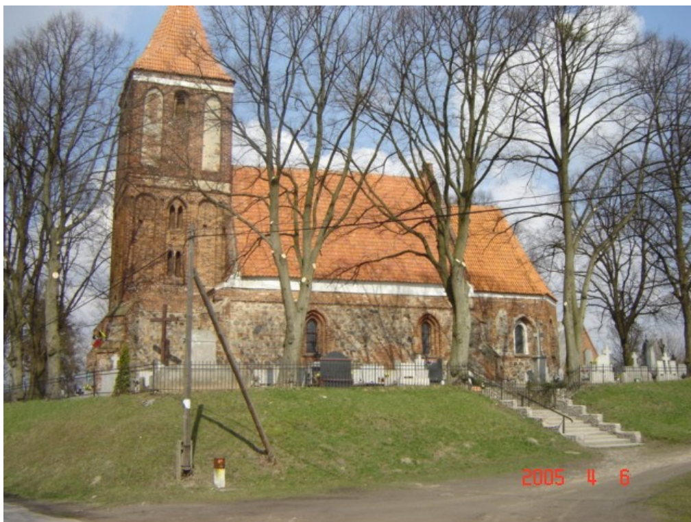
Kościół p.w. św. Apostołów Piotra i Pawła