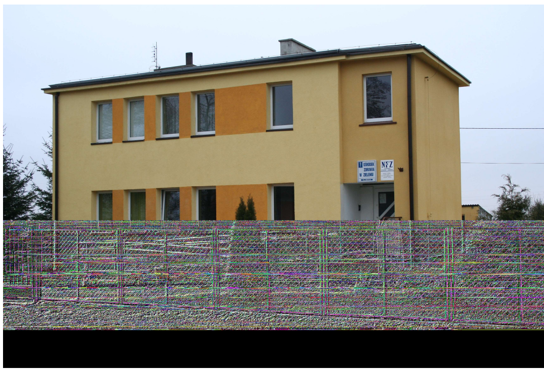
POZ w Zieleniu