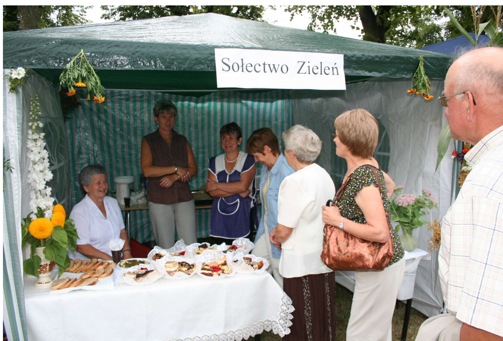
Dożynki gminne w Zieleniu.

Dotychczasowe życie mieszkańców cechuje umiarkowana przedsiębiorczość. Wzbogacają je imprezy o charakterze rozrywkowym, charytatywnym bądź kulturalno - oświatowym. W miarę potrzeb pomieszczenia remizo - świetlicy wynajmowane są na wesela, przyjęcia rodzinne i stypy. We wsi istnieje kilka zorganizowanych grup, niektóre co jakiś czas zajmują się organizacją życia społeczno - kulturalnego. Pozostałe są biernymi obserwatorami bądź uczestnikami.