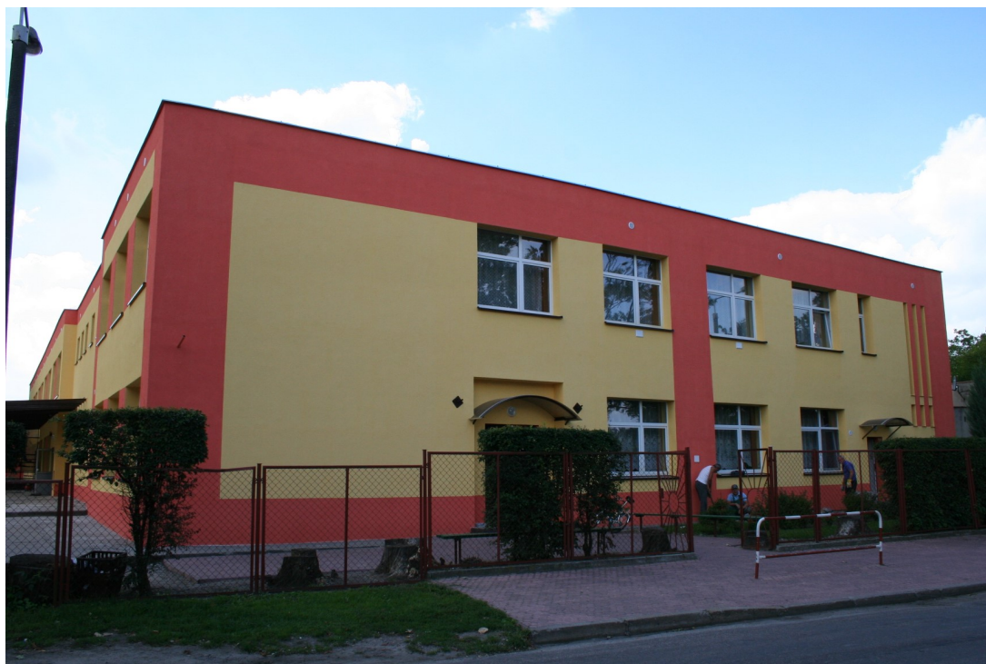
Szkoła w Zieleniu

Na terenie Zielenia istnieje Szkoła Podstawowa im. gen. Tadeusza Kościuszki oraz Niepubliczne Przedszkole w Jarantowicach Oddział w Zieleniu. Ponadto we wsi funkcjonuje remizo-świetlica i Przychodnia Podstawowej Opieki Zdrowotnej. Podstawowe usługi handlowe dla mieszkańców zapewnia sklep ogólnospożywczy.